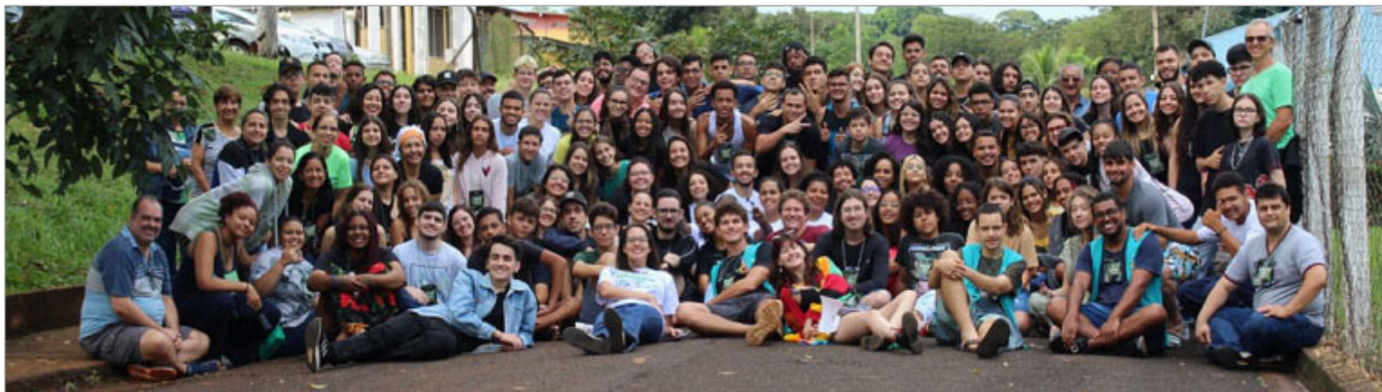
Participantes da COMENESP 2023, Igarapava -SP.

Fica o convite para os novos encontros (logo, logo já tem) e, para saberem mais sobre, é só ficar ligado nas nossas redes sociais pelo @dmiribeiraopreto (Instagram) e @dmiribeiraopreto (Facebook).