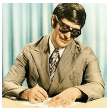
Francisco Candido Xavier

Na época, o movimento de FLEs ganhou força e cada cidade foi se ajustando na forma de conseguir livros e algumas distribuidoras aderiram plenamente à divulgação do livro pelo livro, entre elas o IDE – Instituto de Difusão Espírita, de Araras-SP, seguindo a mesma linha da FEB de oferecer os livros a preço de custo e em consignação. Em pouco tempo 562 cidades estavam realizando a FLE, por todo o Brasil, dentro da mesma filosofia, levar o livro espírita à praça pública, "onde Jesus procura o povo e o povo encontra Jesus", nas palavras de Emmanuel.