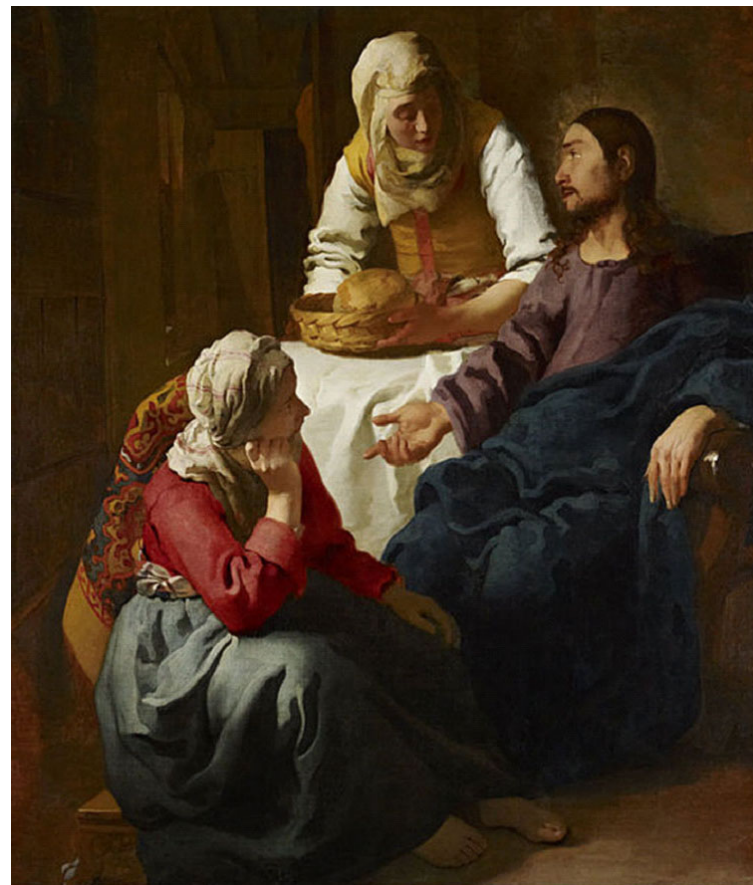
Cristo em casa de Marta e Maria Johannes Vermeer (sec. XVII)

Isso diz respeito à Educação. Tal discernimento é algo a ser aprendido e desenvolvido, resultando em nosso progresso espiritual. Podemos aprender e podemos ensinar também, àqueles que de alguma forma estão sob nossa responsabilidade de educador: fi-