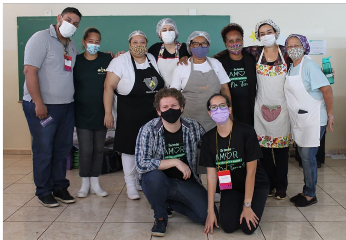
Voluntários na 48ª COMENESP

mo encontro, seja uma prévia ou o próprio encontro em si. Um detalhe: apesar de ser combinado antes da realização do encontro, só se torna concreto e oficial quando a cidade recebe a bandeira.