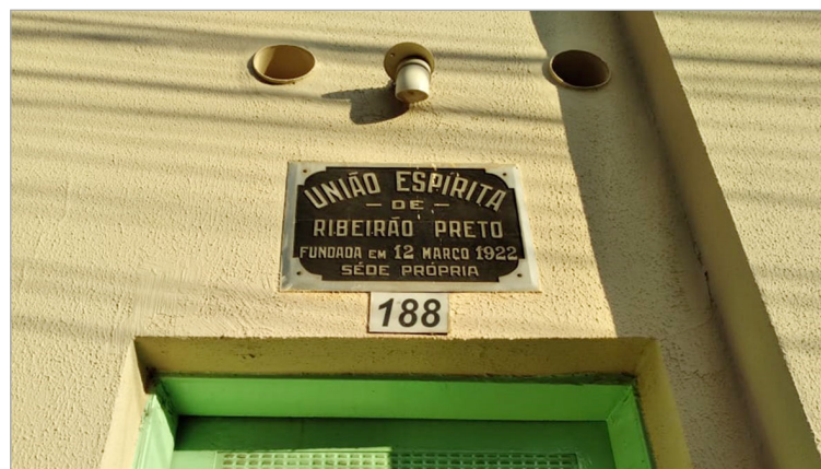
Detalhe da placa na entrada do UNIÃO ESPÍRITA