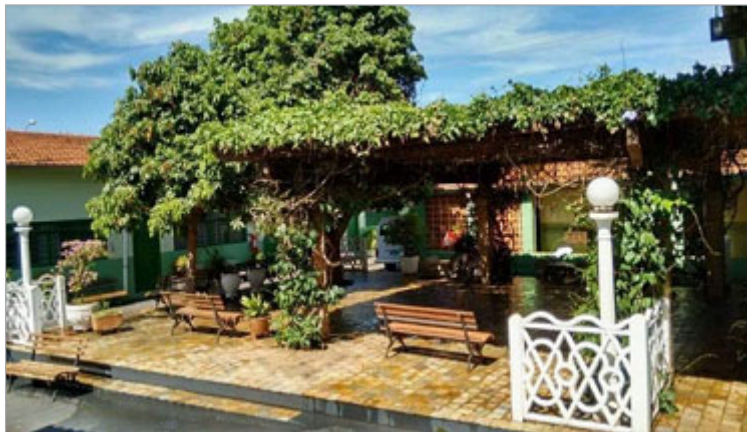
Vista interna do Lar Esperança

entregues foram arrecadados pela campanha permanente de doação, apresentada na página 4.