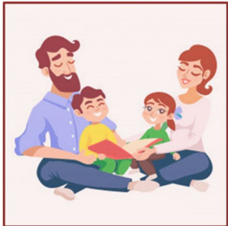
Estreitamento das relações e do diálogo familiar

o encontro presencial. - a adoção do livro espírita como relevante e especial recurso de esclarecimento, con-