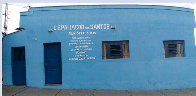
Fachada atual do Centro Espírita Pai Jacob dos Santos