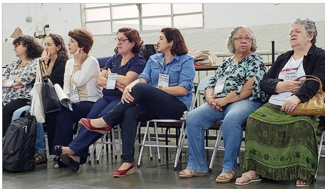
Parte dos participantes de Ribeirão Preto, em Franca.