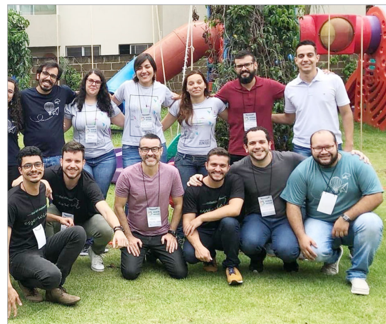
Representantes dos Departamentos de Mocidades, em Franca

blico total de 48 participantes em São João da Boa Vista e 97 em Franca, aproveitaram os momentos de trabalho e convivência fraterna.