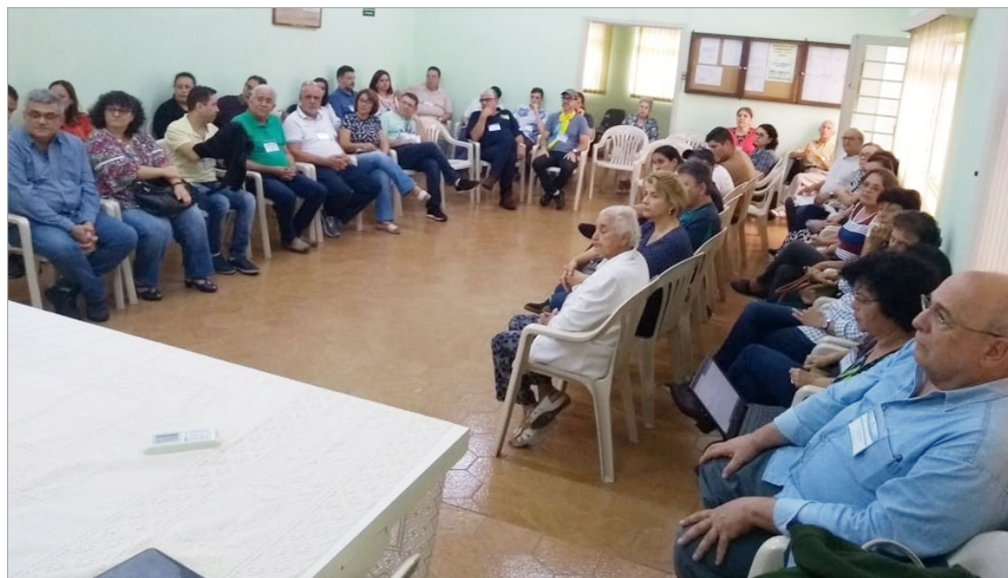
Participantes em São João da Boa Vista

Representantes de mais de 15 municípios e de 12 USEs Intermunicipais, com um pú-