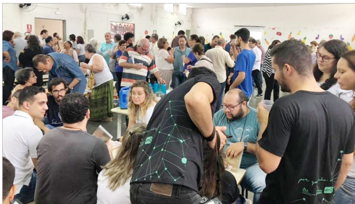
Confraternização dos Participantes, em Franca.

Outro aspecto importante é a Diretoria Executiva não trabalhar isoladamente, mas sim contando com a participação dos representantes dos órgãos de unificação do Estado, formando comissões para que os problemas possam ser melhores analisados, para que efetivamente as soluções sejam definidas e implementadas, não somente pela Diretoria Executiva e departamentos, mas também pelos próprios órgãos.