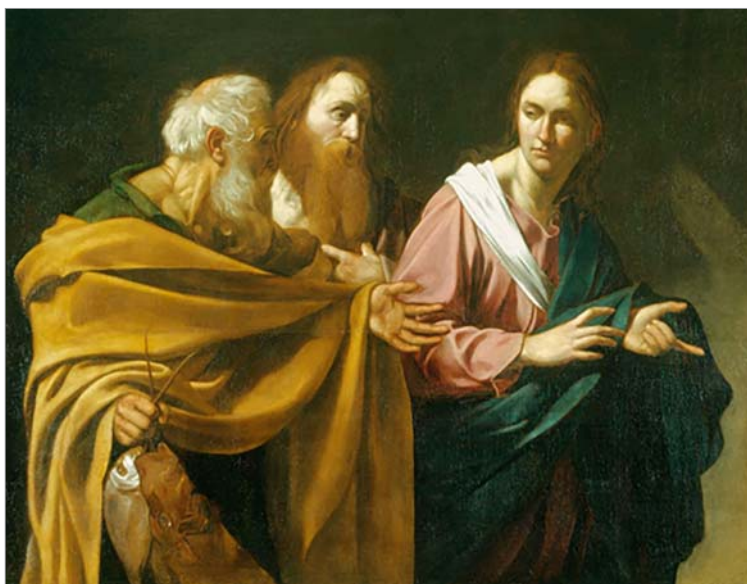
O chamado de Pedro e André. Por Caravaggio, na Royal Collection, em Londres, 1606.

Mas não desistindo de imediato de estar entre os aprendizes, foi buscar com Jesus esclarecer as dúvidas que tais sentimentos trouxeram. Jesus