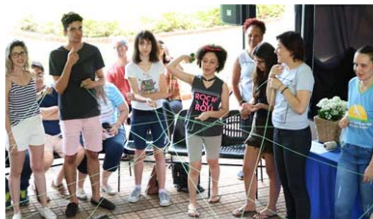
Mocidade na FLERP