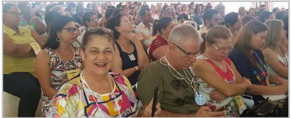
Visão geral do Público