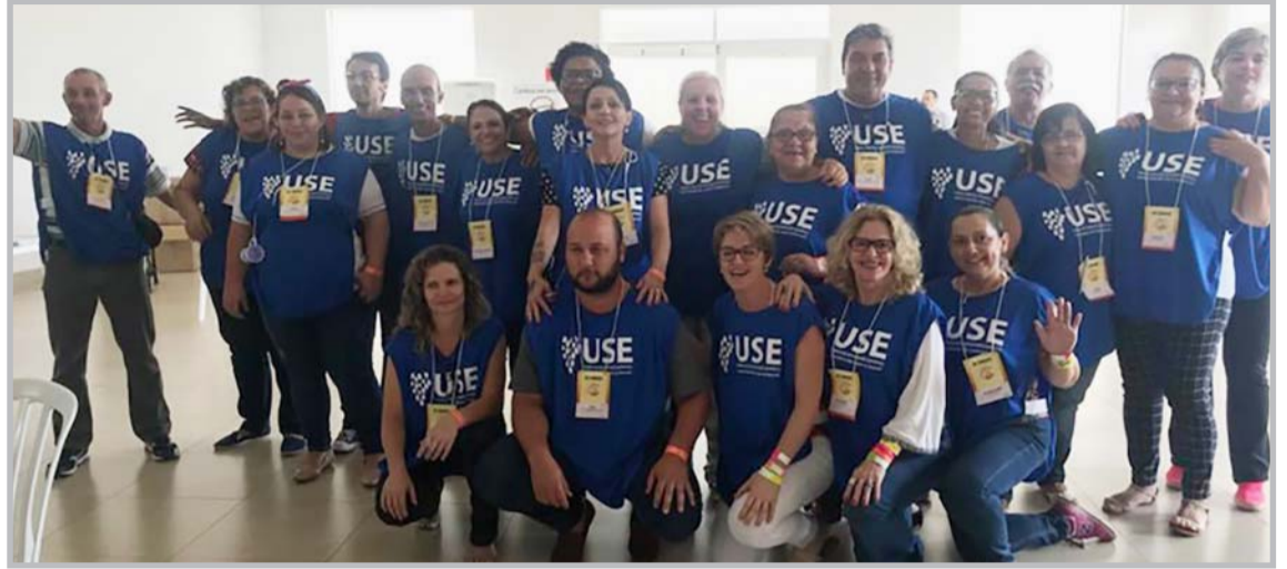
Equipe de trabalhadores responsáveis pelo sucesso da 36ª CONRESPI