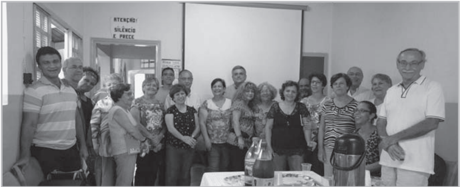
Participantes da reunião no Centro Espírita Donzela de Orleans

O Conselho Deliberativo da Use Intermunicipal de Ribeirão Preto reuniu-se, na sede do Centro Espírita Donzela de Orleans, no Ipiranga, no dia 17 de fevereiro, sábado, das 15 às 17 horas, para a sua reunião mensal ordinária. Estes momentos são muito importantes pois são discutidos os assuntos de interesse do movimento espírita e noticiados todos as atividades programadas pelas casas, pela USE RP, pela USE SP bem como eventos regionais e nacionais. Convidamos a todos para comparecerem na próxima reunião que acontecerá no dia 17 de março, no Centro Espírita Pai Jacob dos Santos, na Rua Barão de Mauá 188 - Vila Virgínia.