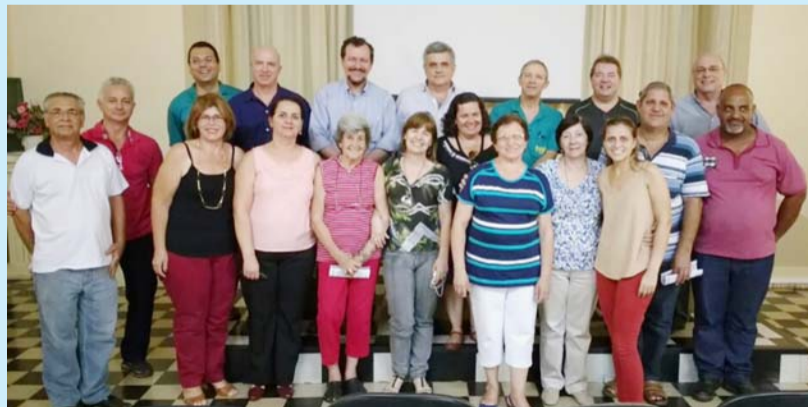
Encontro da USE Regional Ribeirão Preto em Bebedouro