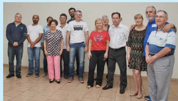
Participantes do Encontro em Rio Claro