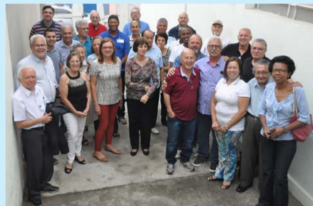
Participantes do Encontro em Taubaté