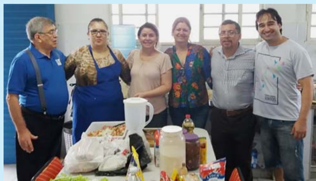
Balieiro com os colaboradores de São José do Rio Preto