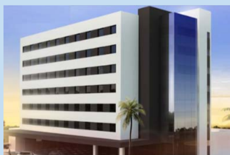
Hotel Parceiro - Alegro by Tauá Atibaia

A modalidade de "passante" com ou sem refeição é feita diretamente com a nossa secretaria ( congresso@usesp.org.br ) e estará aberta até 31/05/2017 ou até completarmos todas as vagas.