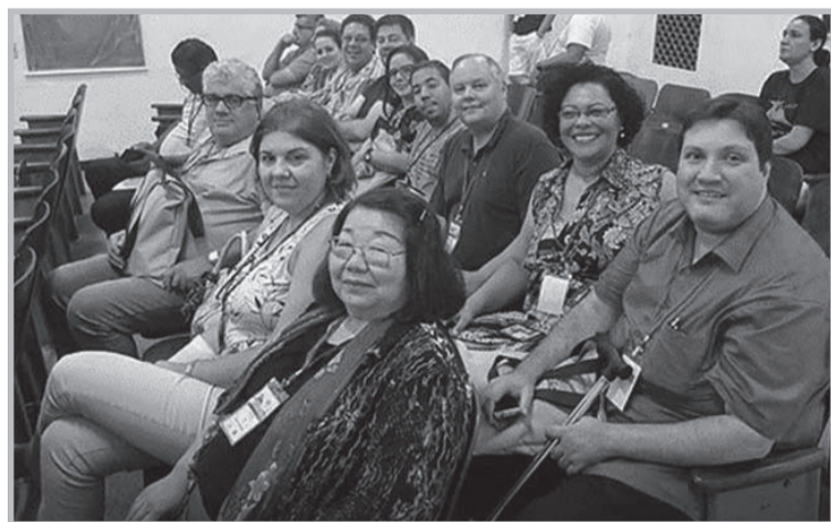
Representantes da USE-SP participaram no Rio de Janeiro, na sede do CEERJ - Conselho Espírita do Estado do Rio de Janeiro, de reunião anual da Comissão Regional Sul do Conselho Federativo Nacional, de 5 a 7 de maio.

Na área de Dirigentes foi analisado o Plano de Trabalho para o Movimento Espírita Brasileiro para o quinquênio 2018-2022, que após o exame de todas as comissões será deliberado na reunião ordinária do CFN de novembro de 2017, reunião que acontece na sede da FEB, em Brasília-DF. O relatório anual de atividades das federativas será apresentado em plataforma própria que está sendo