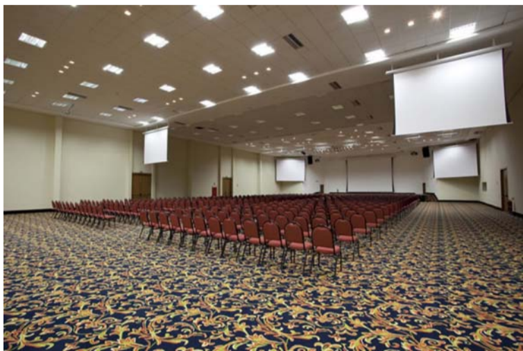
Salão central do Tauá

Solenidade de abertura terá lançamento de Selo dos Correios, edição comemorativa e Conferência de Divaldo Franco