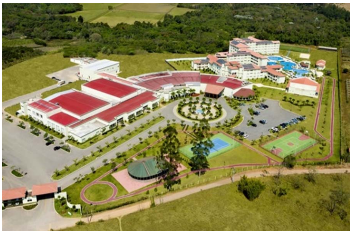
Vista geral do local