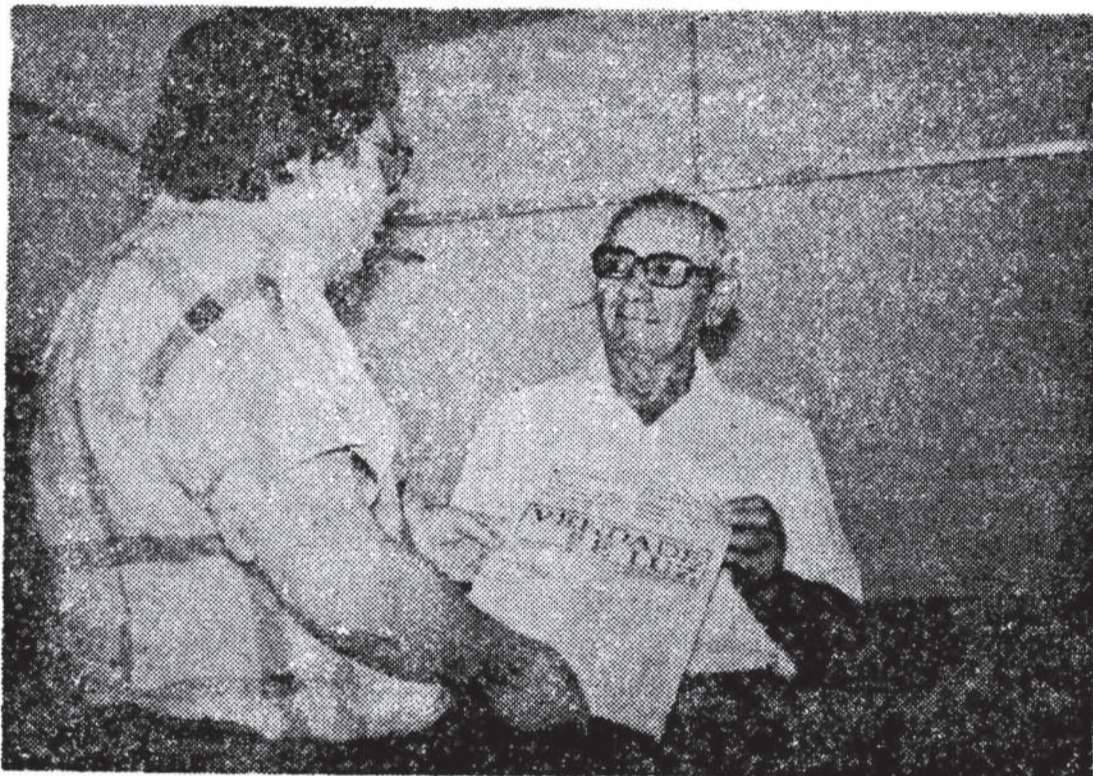
Entrega do 1.º Jornal ao Conselheiro mais idoso, na reunião da UNIME na Sociedade Beneficente Milton Matos

Na reunião do Conselho da UNIME, no último dia 15 de Fevereiro, uma solenidade muito simples marcou a entrega do 1.º exemplar deste jornal à comunidade espírita lá representada.