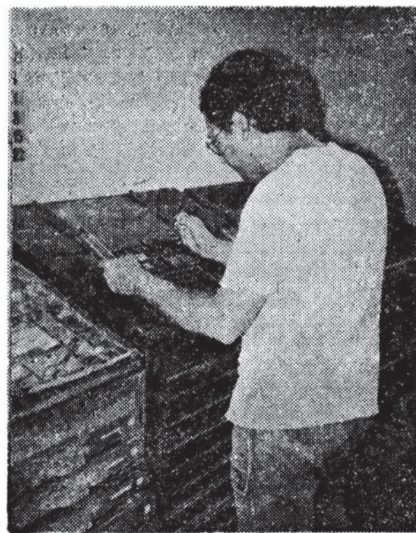
Fase da Montagem na Gráfica Espírita Batuira

Contudo, com o evidente apoio do plano espiritual, que se fez presente desde o início, conseguiu-se o objetivo traçado em Novembro: entregar o jornal na reunião do Conselho em Fevereiro. Mas, se isso pode ser considerado um êxito, ele traz consigo a responsabilidade inerente a todos os êxitos: a continuidade do trabalho, e o número 2 começou a ser objeto de cuidado logo em seguida.