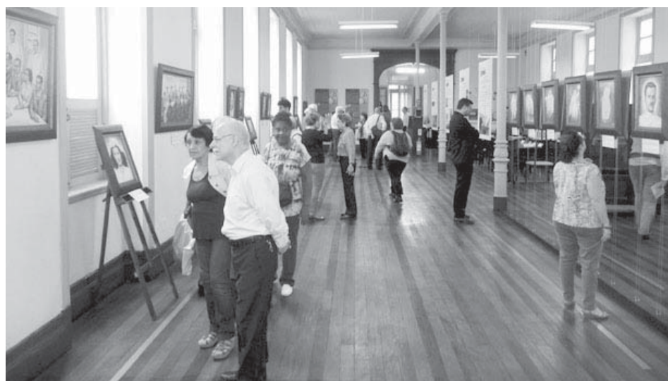
Aberta exposição sobre Chico Xavier na FEB-RIO

Com entrada gratuita, as duas exposições ocorrem de 10 de junho a 10 de setembro de 2014, de segunda à sex-