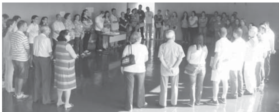
Participantes do curso de monitores do ESDE

Estiveram presentes 43 participantes, das cidades de Ribeirão Preto, Sertãozinho, Bebedouro, Pitangueiras, Taiúva. Uma equipe de 12 pessoas, ligadas aos grupos de ESDE, preparou o encontro com as atividades e um gostoso almoço.