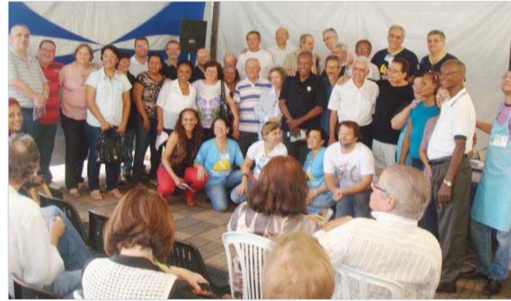
VOLUNTÁRIOS DO DOMINGO FELIZ

Assim é o Domingo Feliz, onde todos são convidados a participar, muitos e incontáveis colaboradores já abraçaram esta ideia, mas ainda estamos esperando na próxima por você!