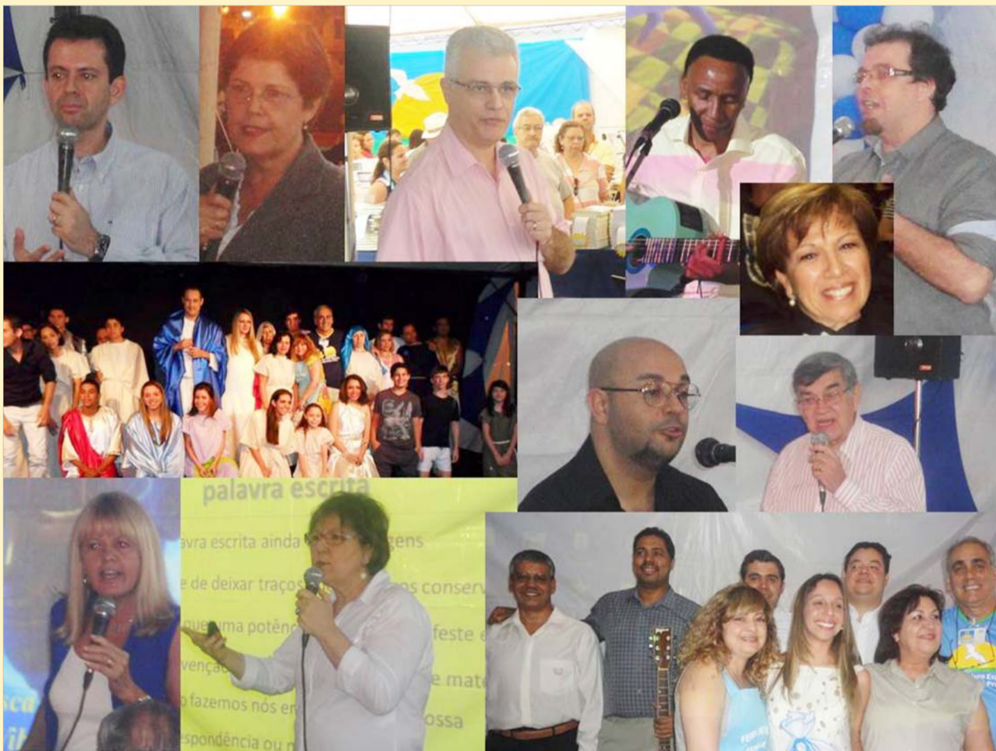
CONFREIRAS E CONFRADES QUE AJUDARAM A ABRILHANTAR A 40ª FEIRA DO LIVRO ESPÍRITA EM 2013.