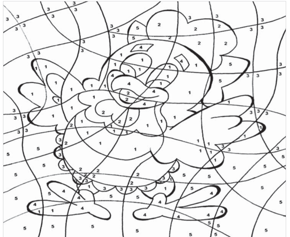
PINTE COM OS NÚMEROS: 1-Amarelo, 2-Vermelho, 3-Azul, 4-Laranja, 5-Verde