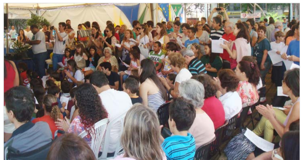
PÚBLICO PRESTIGIANDO O DOMINGO FELIZ