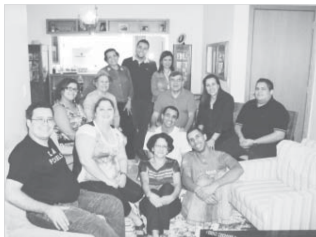
Encontro de Evangelizadores