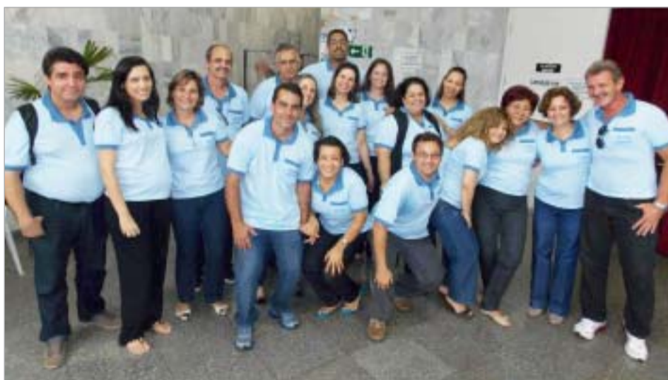
OS TRABALHADORES VOLUNTÁRIOS RESPONSÁVEIS PELA INFRA ESTRUTURA DOS EVENTOS