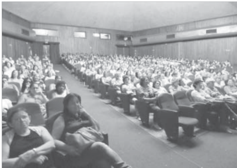
PÚBLICO NO TEATRO MUNICIPAL

Foi uma tarde memorável para quantos estiveram no Teatro Municipal (com todos os seus lugares ocupados). Amigos espíritas, juntos, em clima de festa de corações, que se revelava no brilho do olhar, nos sorrisos francos, na espontaneidade dos abraços.