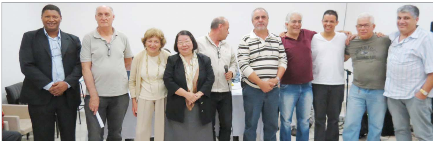
A nova Diretoria Executiva da USE