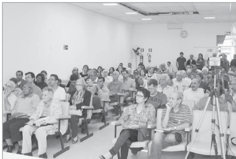
Parte do público presente